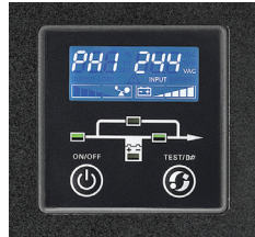
Display LCD con información clara del estatus y mediciones del UPS